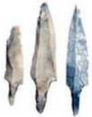
Włócznie do drzewc

15. Który przedmiot jest wykonany z naturalnego materiału?